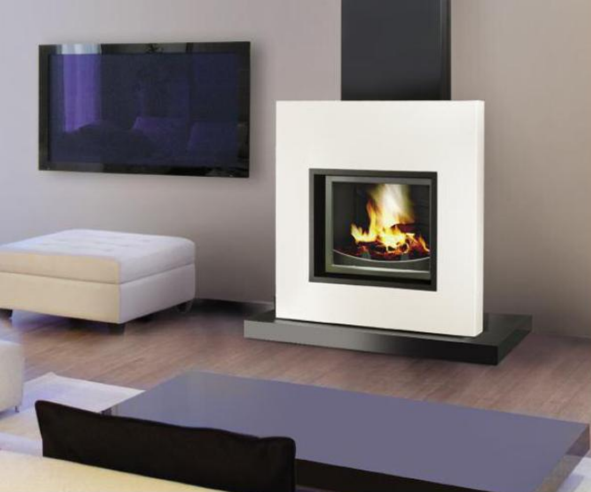
OPTION : • Modèle présenté avec l'option cache-conduit et moyen podium.