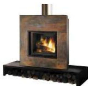
Céramique effet oxydé